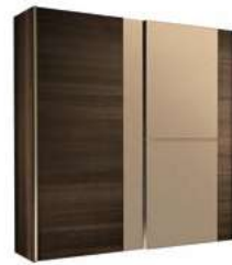
2/D SLIDING WARDROBE (with central mirrors) PJAC0020

in ecoleather inch W 63" D 22" H 18" cm L 160 P 55 H 45 Crts 2 kg 47 m 3 0,32