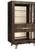
OPEN CABINET PJAC0600RT With 2 drawers inch W 47" D 22" H 74" cm L 120 P 55,1 H 187,3 Crts 3 kg 172 m 3 1,57