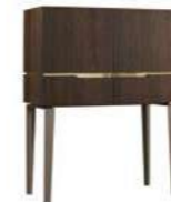
COCKTAIL CABINET PJAC0615RT With 2 doors and pull out shelf inch W 51" D 22" H 67" cm L 130 P 55 H 170 Crts 2 kg 127 m 3 0,83