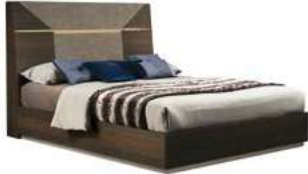
Q.S./UK 5" BED PJAC0150RT (UK FIRE RETARDANT) PJAC0150RTI

With termocotto oak structure, seat and back in same ecoleather as headboard inch W 20" D 24" H 42" cm L 50 P 61 H 107 Crts 1 kg 11 m 3 0,35