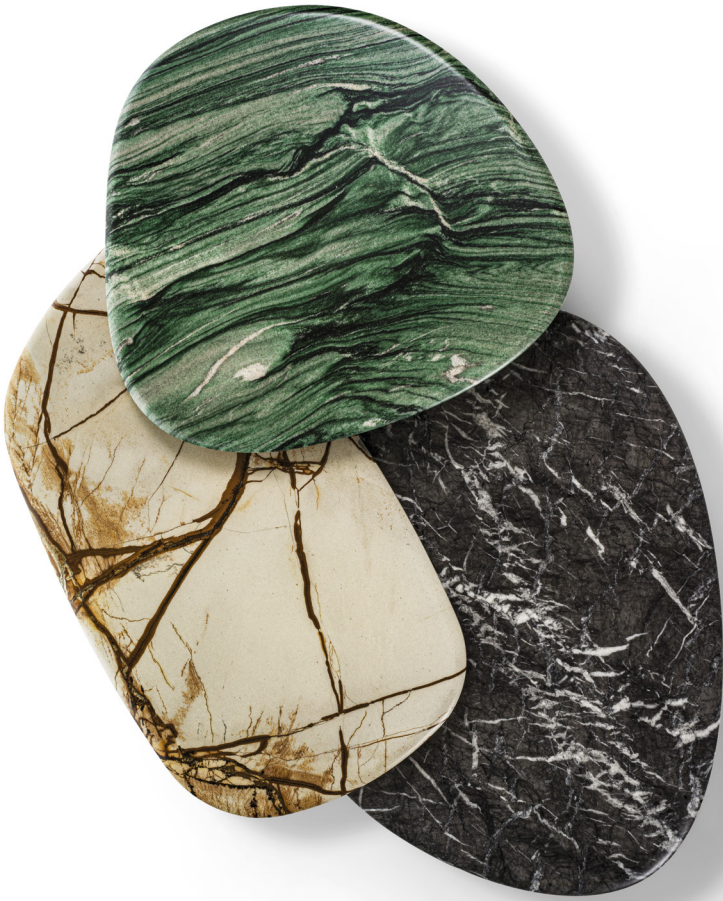
CALLISTO MIX H. 35 - L. 156 - P. 107 H. 13 3/4" - W. 61 3/8" - D. 42 1/8"