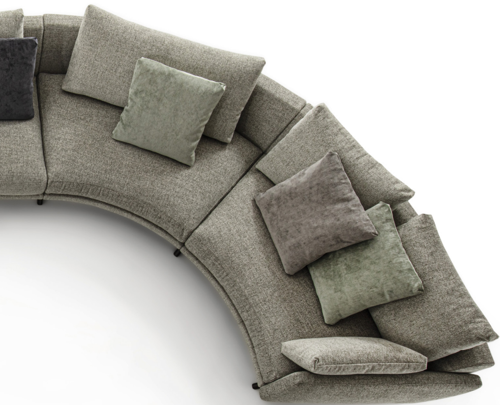
ÉTIENNE comp. I - 1 H. 92 - L. 552 - P. 237 H. 36 1/4" - W. 217 1/4" - D. 93 1/4"