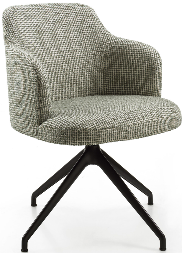
ABBY GIREVOLE H. 80 - L. 57 - P. 61 H. 31 1/2" - W. 22 1/2" - D. 24"