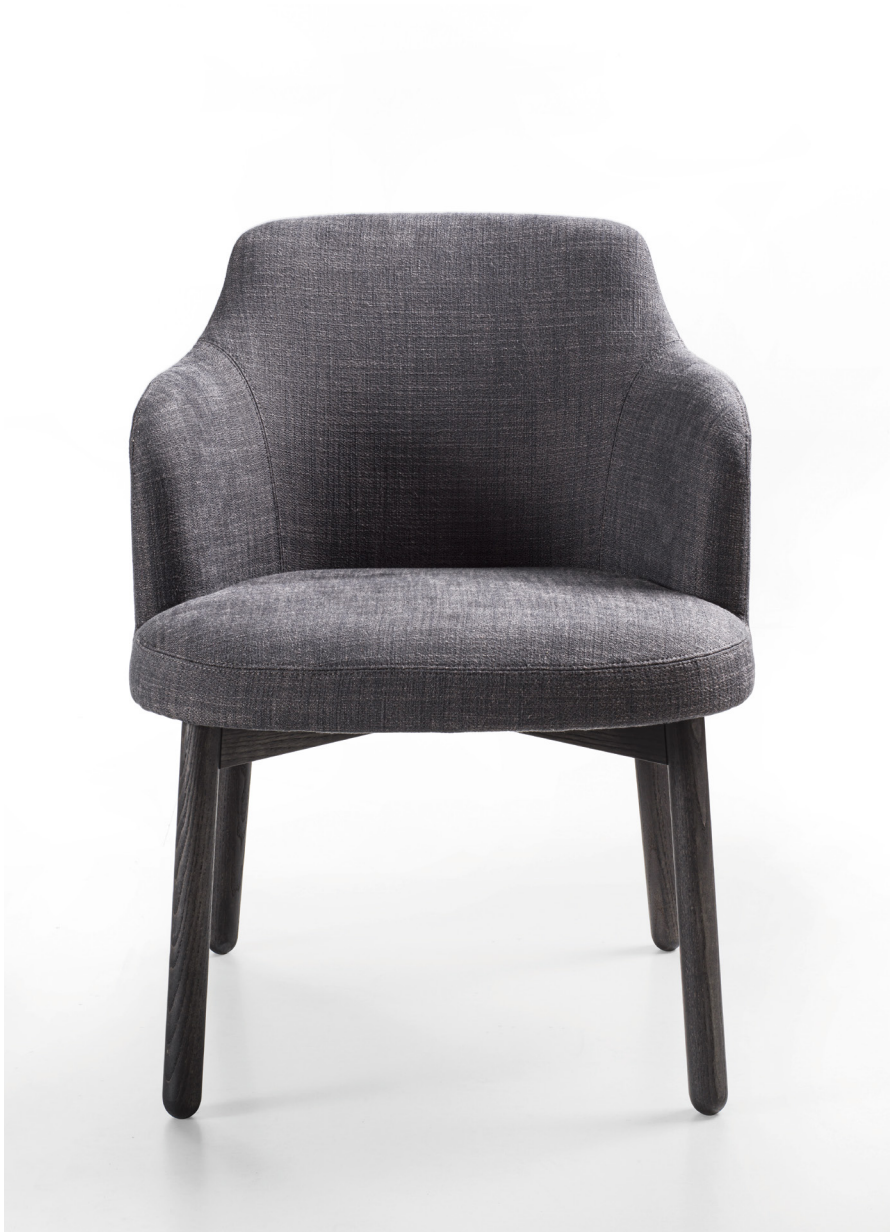
ABBY H. 79 - L. 57 - P. 61 H. 31 1/8" - W. 22 1/2" - D. 24"