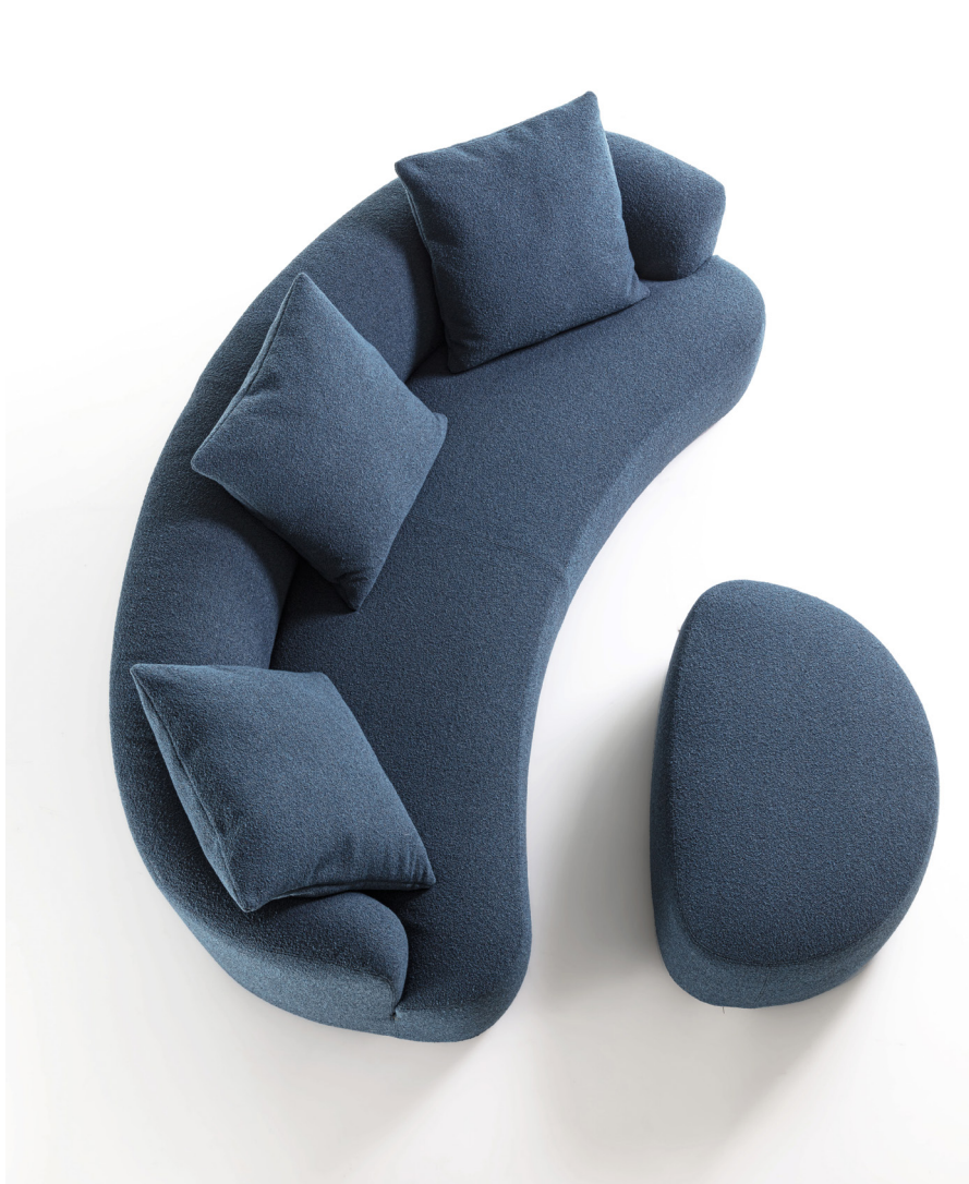
YVES POUF H. 37 - L. 101 - P. 68 H. 14 5/8" - W. 39 3/4" - D. 26 3/4"