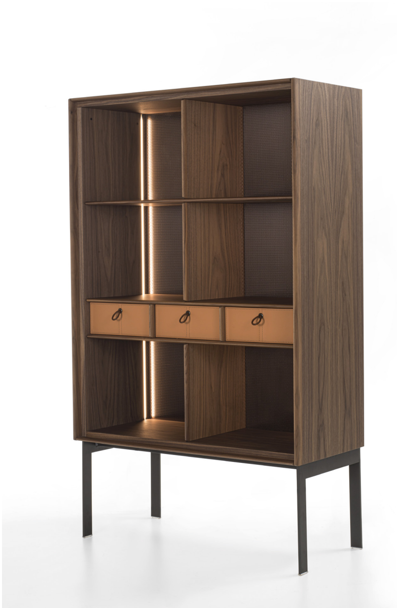
MATICS 2 OPEN-DOOR H. 150 - L. 94 - P. 42 H. 59" - W. 37" - D. 16 1/2"