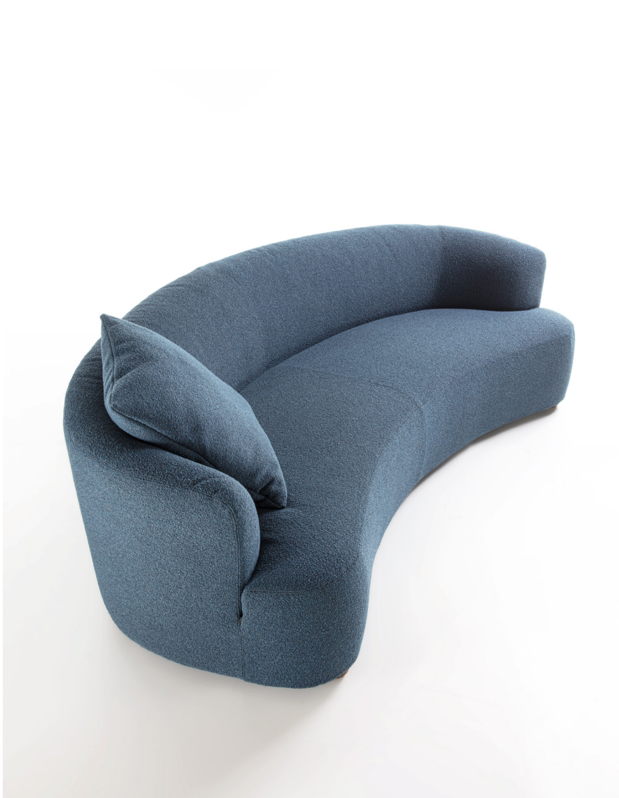
YVES H. 70 - L. 240 - P. 120 H. 27 5/8" - W. 94 1/2" - D. 47 1/4"