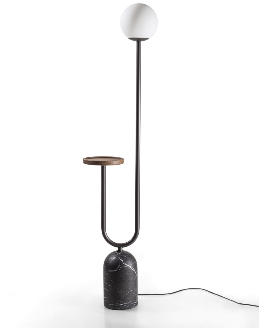
EKERO TOTEM H. 164 - L. 39 - P. 22 H. 64 5/8" - W. 15 3/8" - D. 8 5/8"