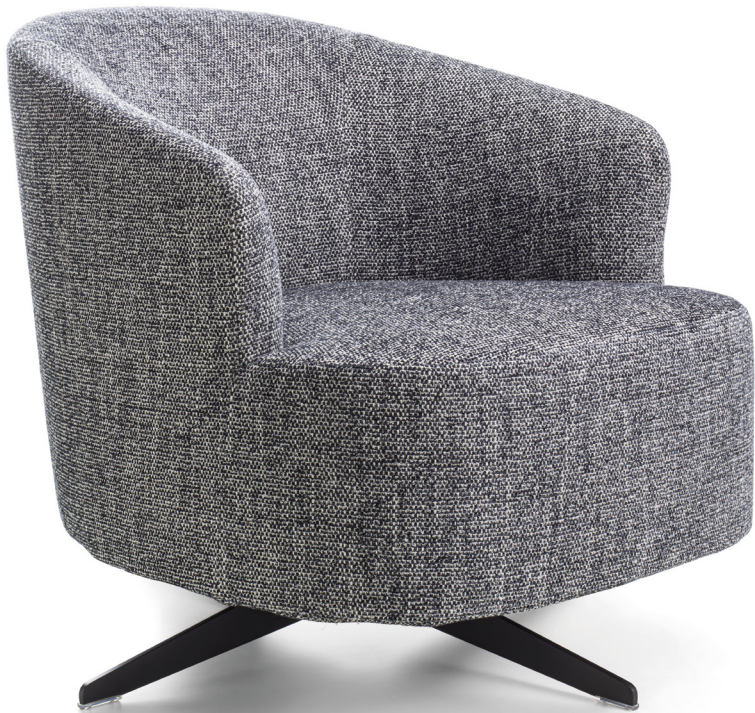
COPINE GIREVOLE H. 69 - L. 69 - P. 82 H. 27 1/8" - W. 27 1/8" - D. 32 1/4"