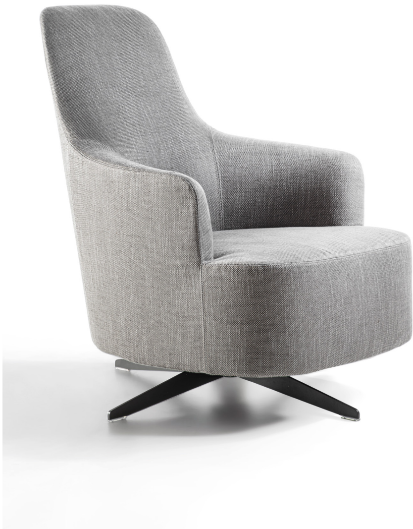
COPINE BERGERE GIREVOLE H. 94 - L. 69 - P. 87 H. 37" - W. 27 1/8" - D. 34 1/4"