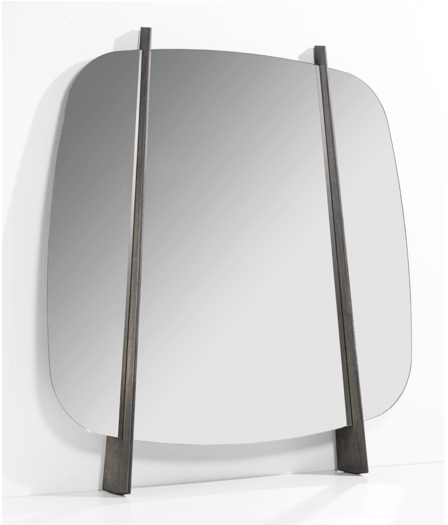
GONG H. 200 - L. 190 - P. 30 H. 78 3/4" - W. 74 3/4" - D. 11 7/8"