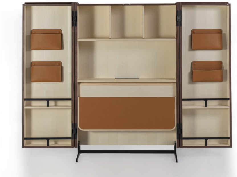
SAVIO H. 150 - L. 100-201 - P. 38-56 H. 59" - W. 39 3/8" - 79 1/8" - D. 15" - 22"