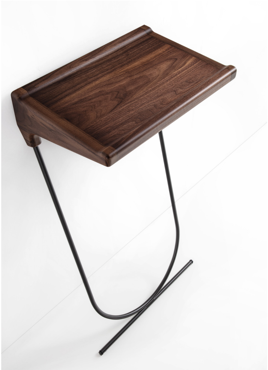
MAORI H. 90 - L. 50 - P. 30 H. 35 1/2" - W. 19 5/8" - D. 11 3/4"