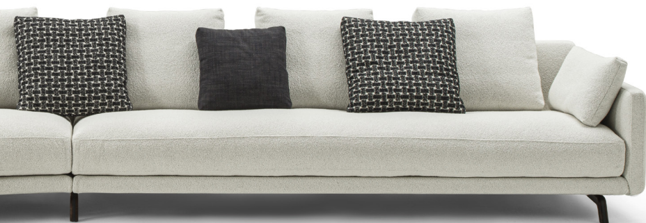
ÉTIENNE comp. D H. 92 - L. 533 - P. 268 H. 36 1/4" - W. 209 7/8" - D. 105 1/2"