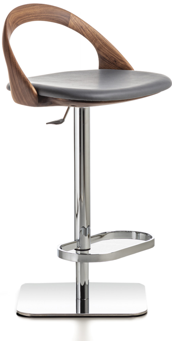
ESTER SGABELLO LIFT H. 74-99 - L. 49 - P. 44 H. 29 1/8"-39" - W. 19 1/4" - D. 17 3/8"