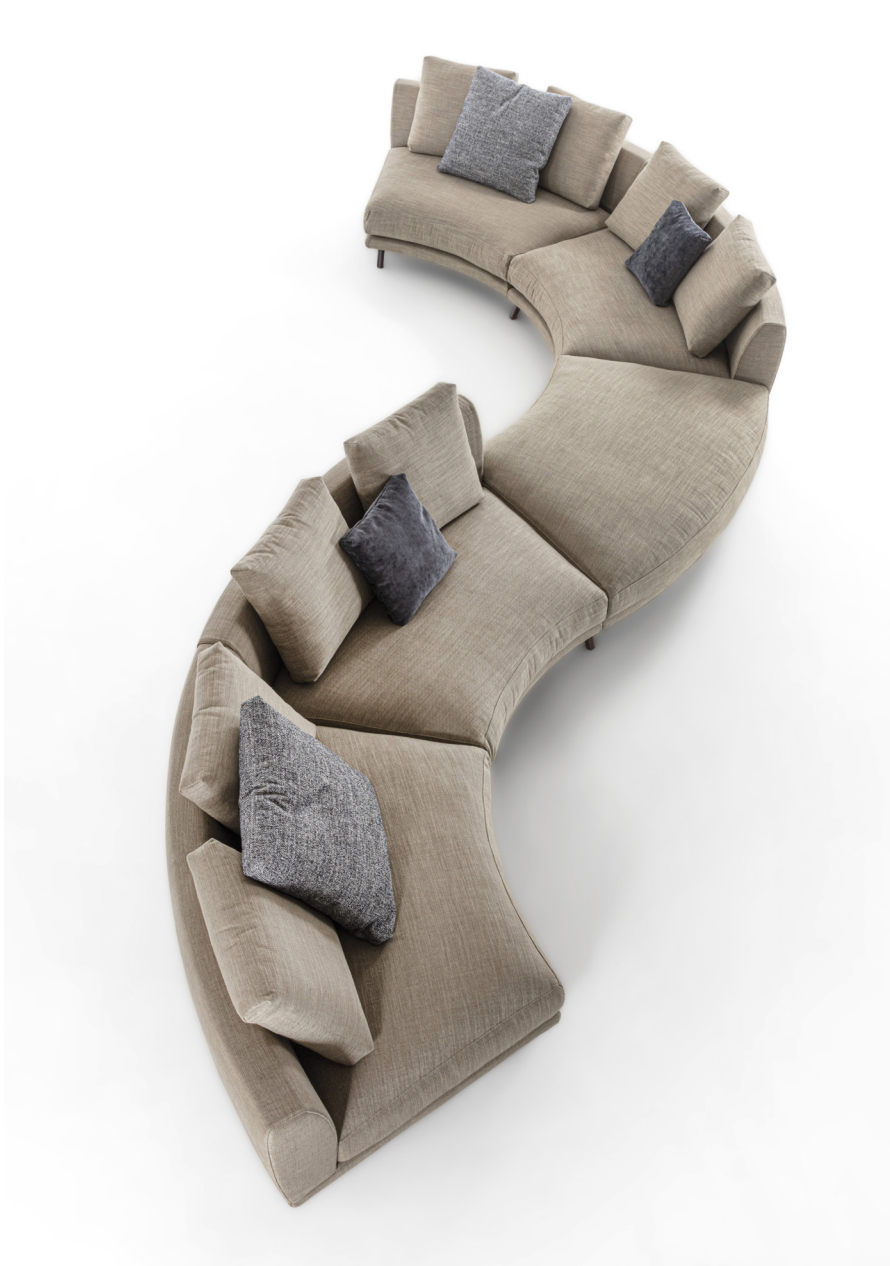
ÉTIENNE comp. H H. 92 - L. 629 - P. 227 H. 36 1/4" - W. 247 5/8" - D. 89 3/8"