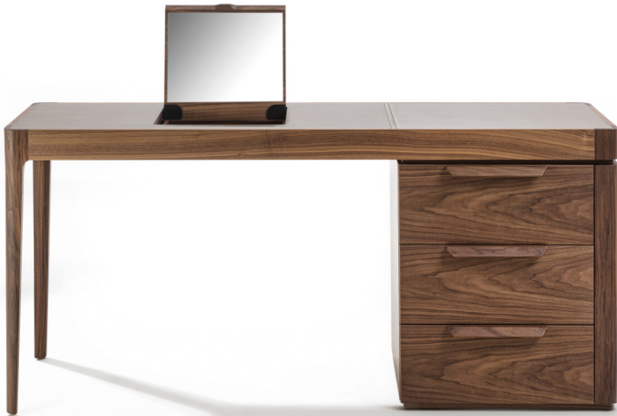
AFRODITE BIJOUX H. 109 - L. 182 - P. 59 H. 42 7/8" - W. 71 5/8" - D. 23 1/4"