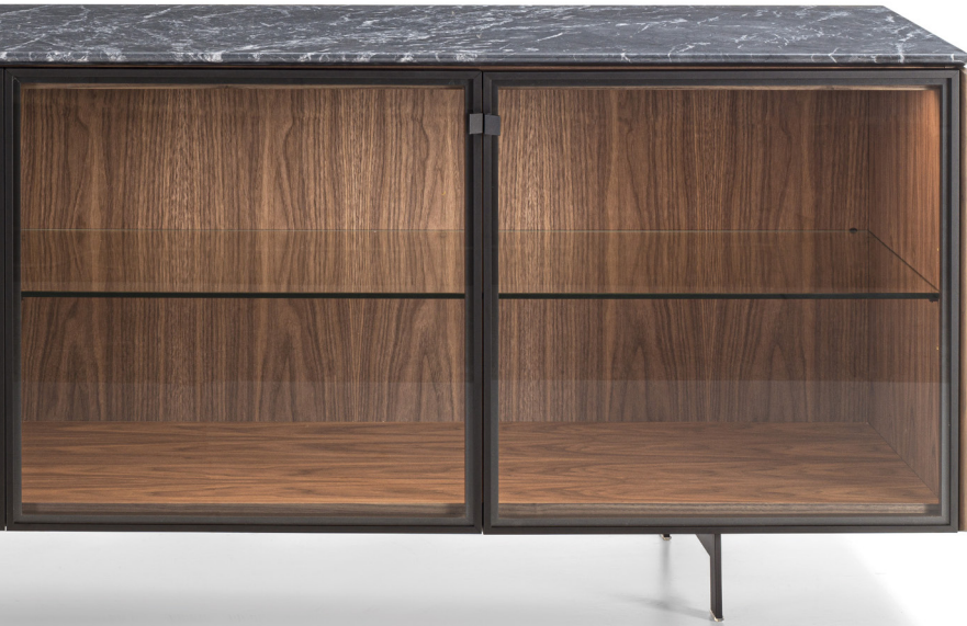
MATICS 4 CRISTALLO H. 74 - L. 239 - P. 56 H. 29 1/8" - W. 94 1/8" - D. 22"