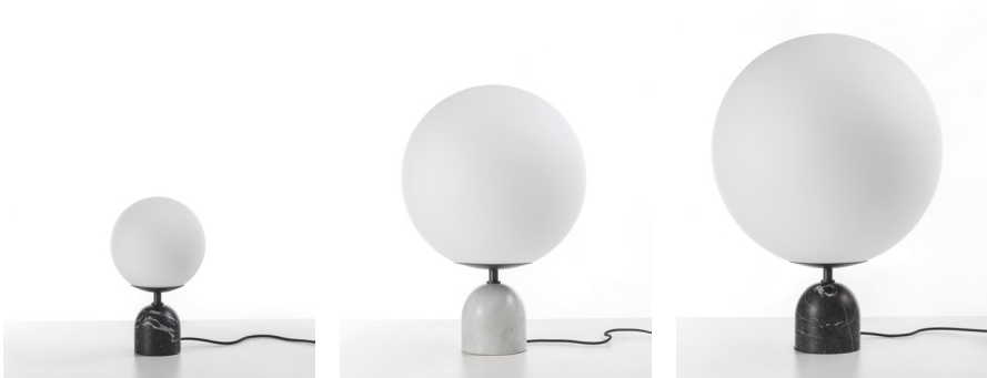
Table lamp with dimmable LED lighting. Cylindrical marble base available in white Carrara or grey Carnico, central pole in grey pewter metal and diffuser in white opal frosted glass.

Lampada da tavolo con luce LED dimmerabile. Base cilindrica in marmo bianco Carrara o grigio Carnico, stelo centrale in metallo verniciato finitura grigio peltro e diffusore in vetro opalino bianco acidato.