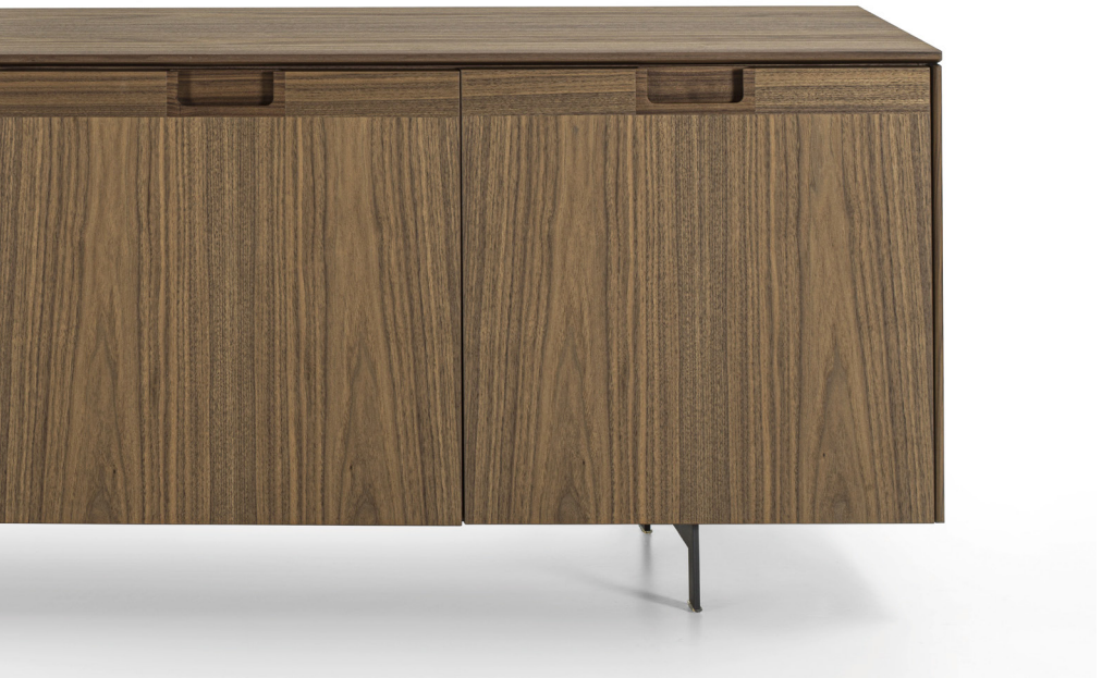
MATICS 4 LEGNO H. 74 - L. 239 - P. 56 H. 29 1/8" - W. 94 1/8" - D. 22"