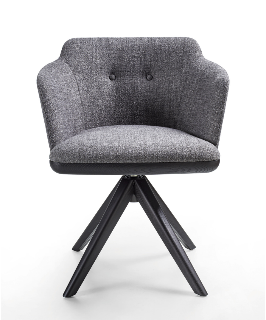
CELINE GIREVOLE H. 76 - L. 61 - P. 55 H. 29 7/8" - W. 24" - D. 21 5/8"